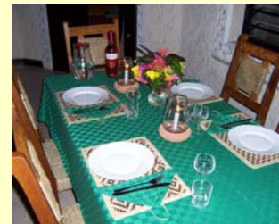
Esstisch auf der Terrasse