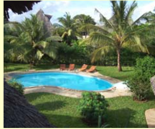
Pool und Garten