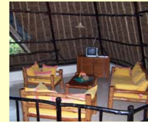
Sitzecke 1. Stock

Die 160m 2 große Villa liegt ca. 550m vom Traumstrand Diani Beach des Indischen Ozeans entfernt. Im Erdgeschoss befinden sich zwei Schlafzimmer, ein Badezimmer und eine Küche. Die Küche hat einen separaten Eingang für das Personal. Das Obergeschoss besteht aus einem großen Wohnbereich, von ca. 70qm, mit einer offenen Galerie. (nicht mit Rollstuhl zugänglich) Das hohe Makuti-Dach sorgt zusammen mit großdimensionierten Giebelöffnungen für ein angenehmes Raumklima ohne Klimaanlage. Zusätzliche Abkühlung ist in allen Schlafräumen durch Deckenventilatoren gewährleistet. Alle Betten sind mit Moskitonetzen ausgestattet und im eingebauten Kleiderschrank eines Schlafzimmers befindet sich ein Safe für ihre persönlichen Wertsachen. Für den Aufenthalt im Freien stehen Ihnen auf der großen Terrasse ein großer Esstisch und eine einladende Sitzgruppe mit großer Hängecouch zur Verfügung. Hier können Sie bei herrlichem Ambiente die Mahlzeiten einnehmen und haben einen traumhaften Blick auf den Pool und den 1600m 2 großen tropischen Garten. Das Haus ist mit landestypischen Möbeln eingerichtet und man muss auf den gewohnten europäischen Komfort nicht verzichten.