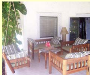
Sitzecke auf der Terrasse