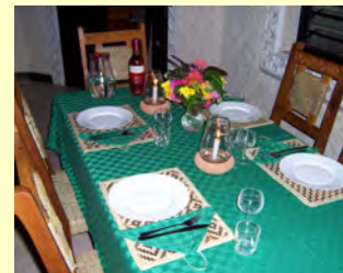
Esstisch auf der Terrasse