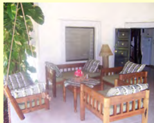
Sitzecke auf der Terrasse

Das Haus ist mit landestypischen Möbeln eingerichtet und man muss auf den gewohnten europäischen Komfort nicht verzichten.