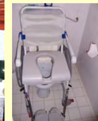
Toilette mit Dusch- / Toilettenrollstuhl