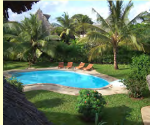
Pool und Garten