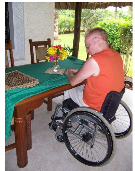
Esstisch auf der Terrasse